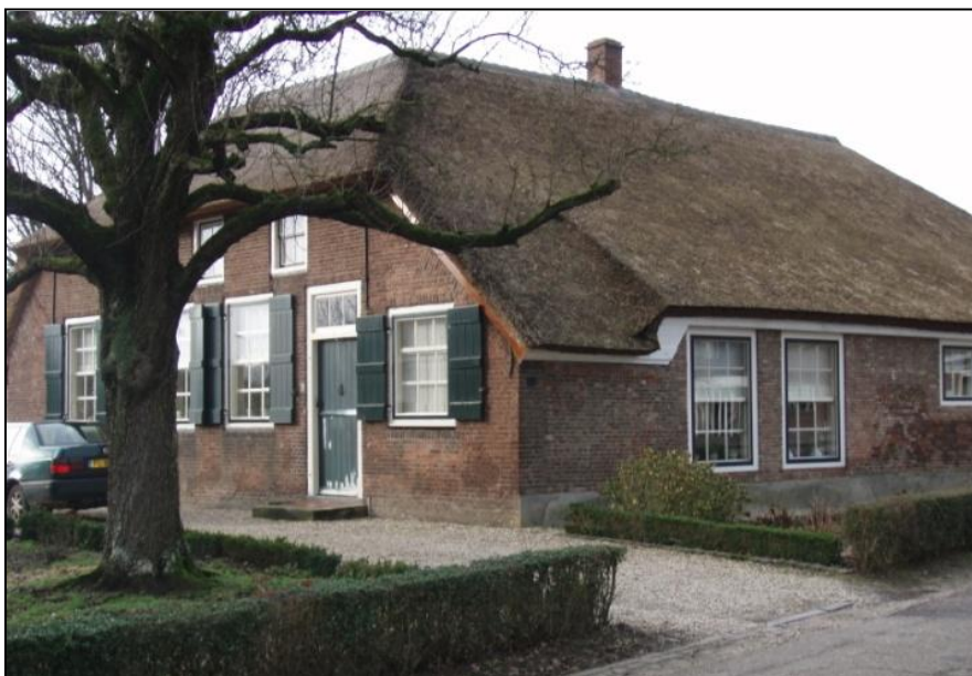
Heust 19 in 2010