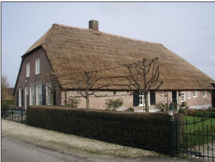
Zandweg 2 "De Vriendschap" in 2014