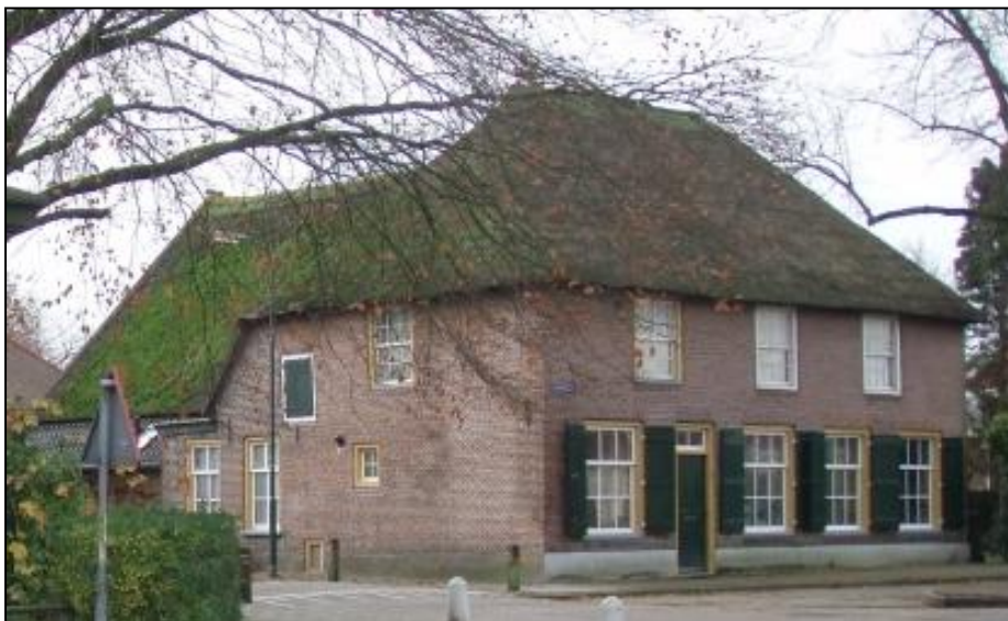
Ruim 100 jaar later is er nog weinig aan het pand veranderd