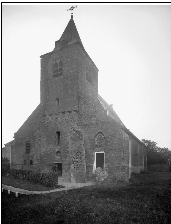
Toren kerk in 1909