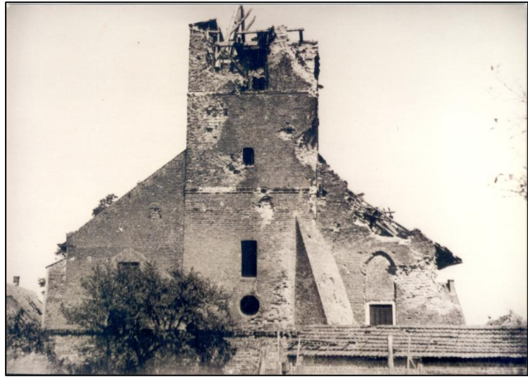
Klok van Jan Moer Oorlogsschade toren