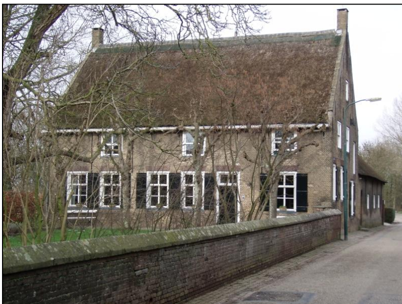
Heust 3 in 2013