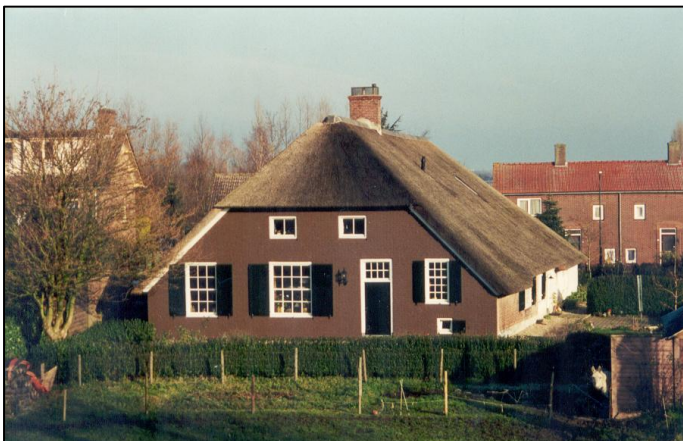
De woonboerderij in 2010