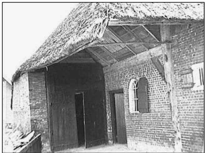
Klemit 9 op kavel 225 in 1980